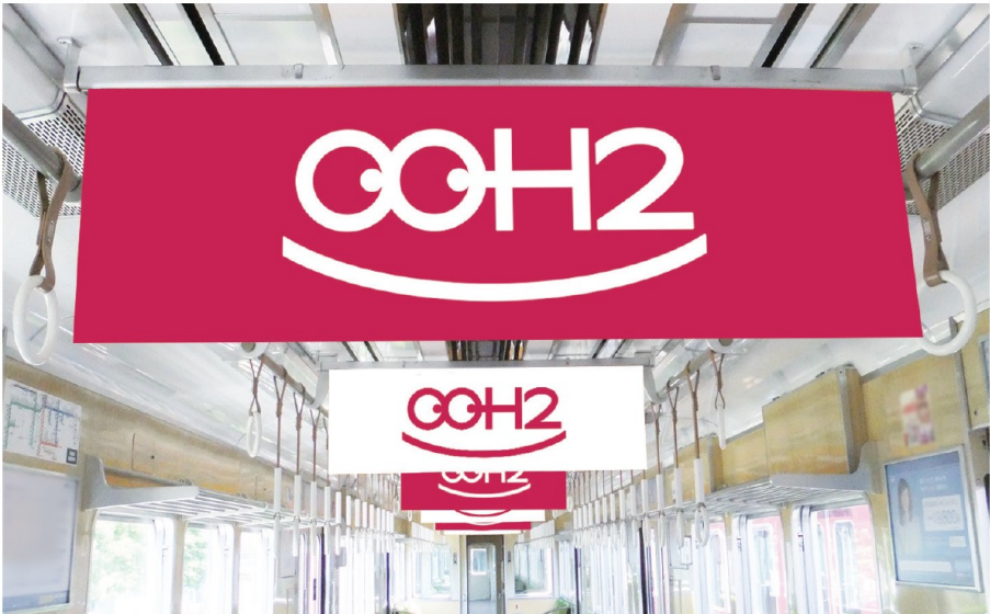
位置図 ※AもしくはBどちらかに掲出されます。(指定不可)

●神戸線・宝塚線・京都線の各5編成限定。中吊り片面を1社でジャックする中吊り媒体です。 連続して目に飛び込むポスターは、集中的なPRに最適。