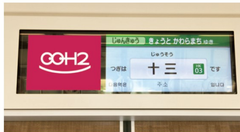
ディスプレイサイズ